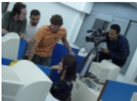
Alunos de Desenho Industrial avaliam interfaces de sites

TESTE DE USABILIDADE É UMA TÉCNICA FUNDAMENTAL UTILIZADA PELO ARQUITETO DE INFORMAÇÃO E PELO DESIGNER DE INTERFACE. É UMA ETAPA DO DESIGN CENTRADO NO USUÁRIO.